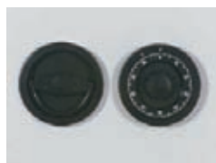
Mech. ZK Schloss Art. Nr.: 59020