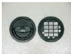
DFS Schloss Art. Nr.: 59021 Art. Nr.: 59022 Art. Nr.: 59026