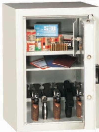
Abb.Art.-Nr.59004 m. Schloß Art.-Nr. 59021, Innentresor Art.-Nr.59023 und Fachboden Art.-Nr.59024 gg. Mehrpreis

Sonderlackierung gegen Aufpreis möglich!