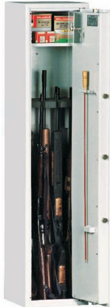
Abb.: Art.-Nr. 50002 mit DB-Schloss (Standard)

Sonderlackierung gegen Aufpreis möglich!