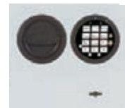
DFS Schloss mit mechanischer Revision Art. Nr. 50032