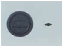
Klappgriff DB Standard