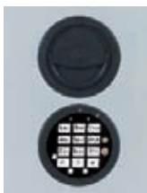
Abb. DFS Schloss Art. Nr. 49021 Art. Nr. 49023