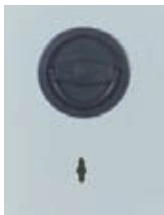
Klappgriff DB Standard