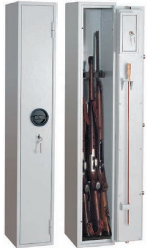
Abb.: Art.-Nr. 49000

Sonderlackierungen in anderen RAL-Farben gegen Aufpreis möglich!