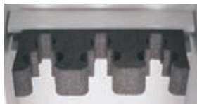
3 Waffenhalter 55mm Abstand