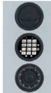
DFS Schloss mit mechanischer Revision Art. Nr. 49525