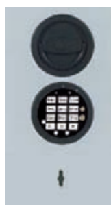
DFS Schloss mit mechanischer Revision Art. Nr. 49524