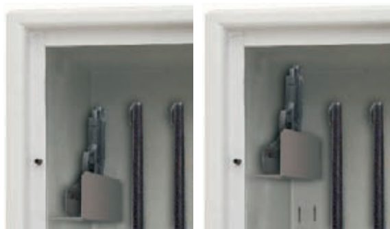
Der serienmäßige Halter für 1 Kurzwaffe ist im Raster von 100 mm ab 900 mm Innenhöhe nach oben in der Rückwand einhängbar.