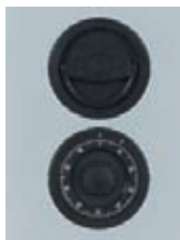
Mechanisches ZK Schloss Art. Nr.: 49520