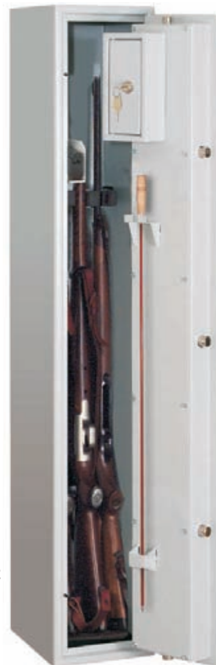
Abb.: Art.-Nr. 49500