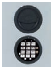
Abb. DFS Schloss Art. Nr. 49521