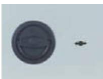
Klappgriff DB Standard

Sonder- Maße u. Ausführungen gg Mehrpreis lieferbar