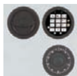
DFS Schloss mit 51535