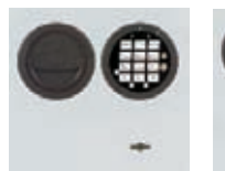
DFS Schloss mit 51534