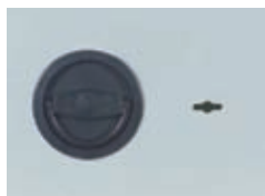
Klappgriff DB Standard