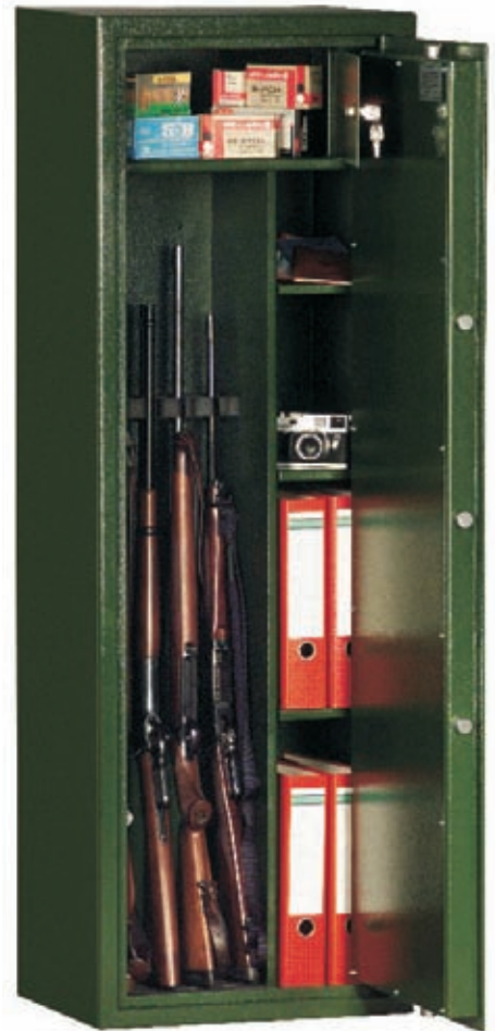
Art. 53601 als Kombischrank (Standard) 4 Waffenhalter, 3 Fachböden 4 Waffenhalter lose zum nachtr. Einbau (s. kleines Foto) serienmäßig.

Bis 10 Langwaffen und bis 10 Kurz Waffen, Munition im Innenfach (Schrank muss verankert werden!).