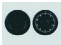
Mechanisches ZK Schloß Art. Nr.: 53622