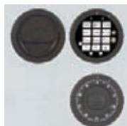
DFS SB Schloß mit mechanischer Revision Art. Nr. 53625