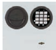
DFS SB Schloß mit mechanischer Revision Art. Nr. 53624