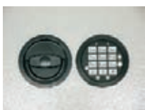
Abb. DFS SB Schloß Art. Nr. 53623