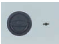
Klappgriff DB Standard

Sonder- Maße u. Ausführungen gegen Mehrpreis lieferbar