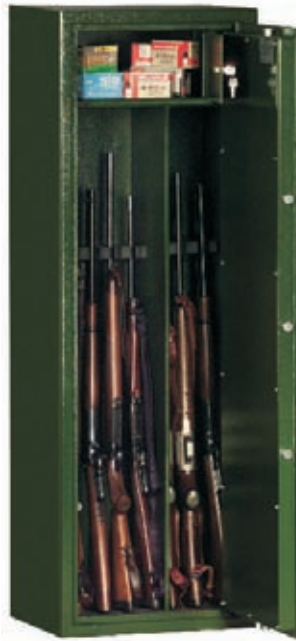
Art. 53601 kompl. m. Waffen

Standardlackierung: RAL 7035 grau bzw. RAL 6020 grün (bitte bei der Bestellung angeben!) Sonderlackierung gegen Aufpreis möglich!