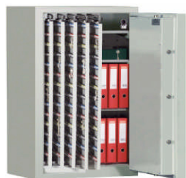
auch als Kombi-Schrank mit Schlüsselafeln auf Teleskopschienen und Ordnerfach lieferbar (s. Katalog Seite 28)