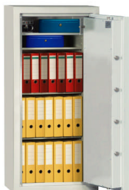
Art. 41006 mit Art. 41023 gg. Aufpreis

30 Minuten Feuerschutz für Papier bis ca. 840°C durch Spezialfüllungen in den Wandungen und spez. Dichtungen. Feuerschutz LFS 30P nach Euro-Norm prEN 15659